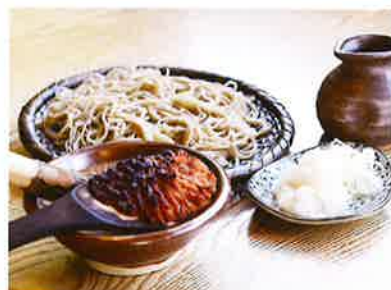
信州そば発祥の地 伊那 高遠そば